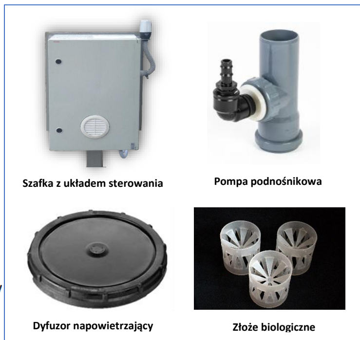
Szafka z układem sterowania